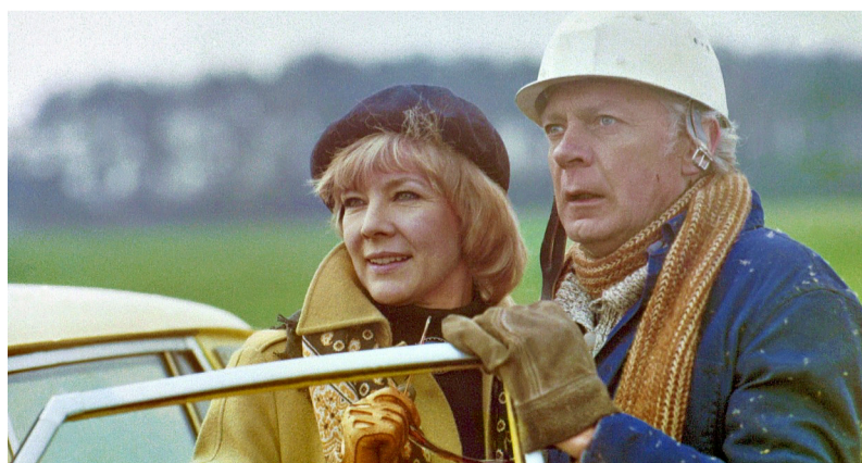
Ralf Keul – gespielt von Rolf Herricht – und seine Frau Doris – gespielt von Annekathrin Bürger – wollen ein Sommerhaus bauen.

In dem Film geht es um Ralf Keul – gespielt vom in der DDR sehr beliebten Rolf Herricht –, ein bekannter Entertainer bei Theater und Fernsehen. Als er sich mit seiner Frau Doris – gespielt von Annekathrin Bürger – mit den erwachsenen Töchtern bei seinen