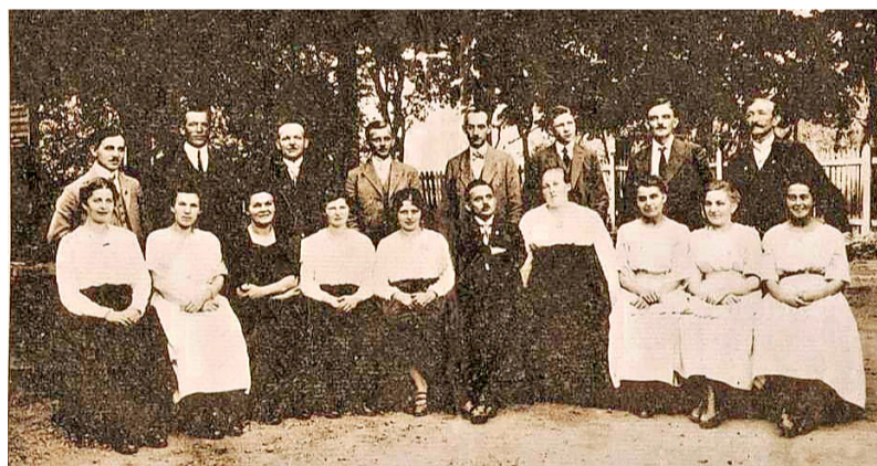
Die Gründungsmitglieder des Chores im Jahr 1906

Man sieht es dem Saal bereits an, bevor am heiligen Dienstag gegen 19 Uhr die Mitglieder zur Chorprobe eintrudeln. Überall hängen Erinnerungsstücke, Auszeichnungen, Fotos und Urkunden an den Wänden. Die Bilder zeigen